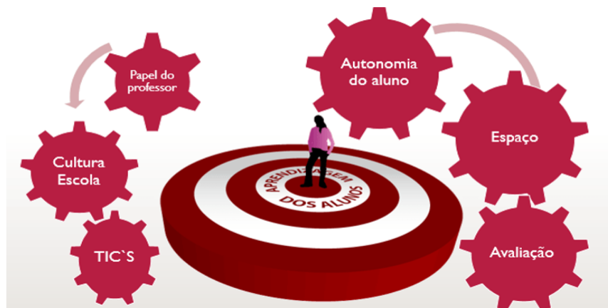
Figura 2: Aprendizagem dos alunos com Metodologias ativas/inovadoras